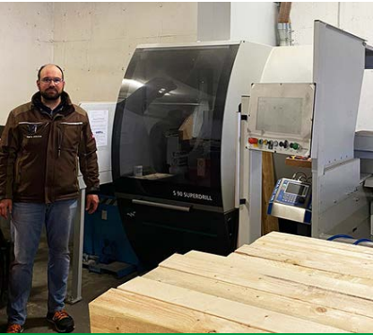
Auf dem Bild: OptiCut S 90 XL Superdrill

Bohrungen, sowie Quer- und Längsfräsungen in nur einem Arbeitsgang vorgenommen werden, wobei eine bessere Qualität des Endproduktes garantiert ist. Die kompakte Maschine und deren Qualität steht für höchste Präzision und geringen Wartungsaufwand. Dies in Kombination mit der einhergehenden Betriebsoptimierung erhöhen deutlich den Ertrag. Darüber hinaus ist die OptiCut S 90 XL Superdrill energetisch so konzipiert und optimiert, sodass sie nicht nur für mehr Flexibilität im Bereich der Fertigung und einer enormen Zeitersparnis sorgt, sondern zudem wertvolle Ressourcen schont. Für eine noch höhere Wertschöpfung und Vielfältigkeit kann die Optimierungskappsäge mittels integriertem Ink-Jet-Drucker die Werkstücke auf der gesamten Länge mit hochauflösenden Texten und Logos bedrucken. Jedoch überzeugte Herr Johannes Kirchner nicht nur der technische Aspekt der Maschine, sondern von Anhieb auch die sehr gute Beratung, die gesamte Betreuung während der Konzeption und Umsetzung sowie die praxisnahe Inbetriebnahme, welche einen Rundumservice bei Frage- und Problemstellungen inkludierte, der WEINIG Dimter GmbH. Zudem betont Herr Kirchner von der Weck-Holz GmbH, dass die gesamte Abwicklung, vom Kauf bis zur Inbetriebnahme, rundum einen perfekten Prozess darstellte.